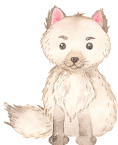
le renard polaire