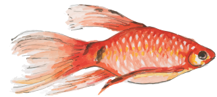
le poisson rouge