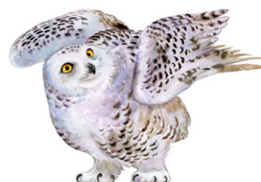
la chouette polaire